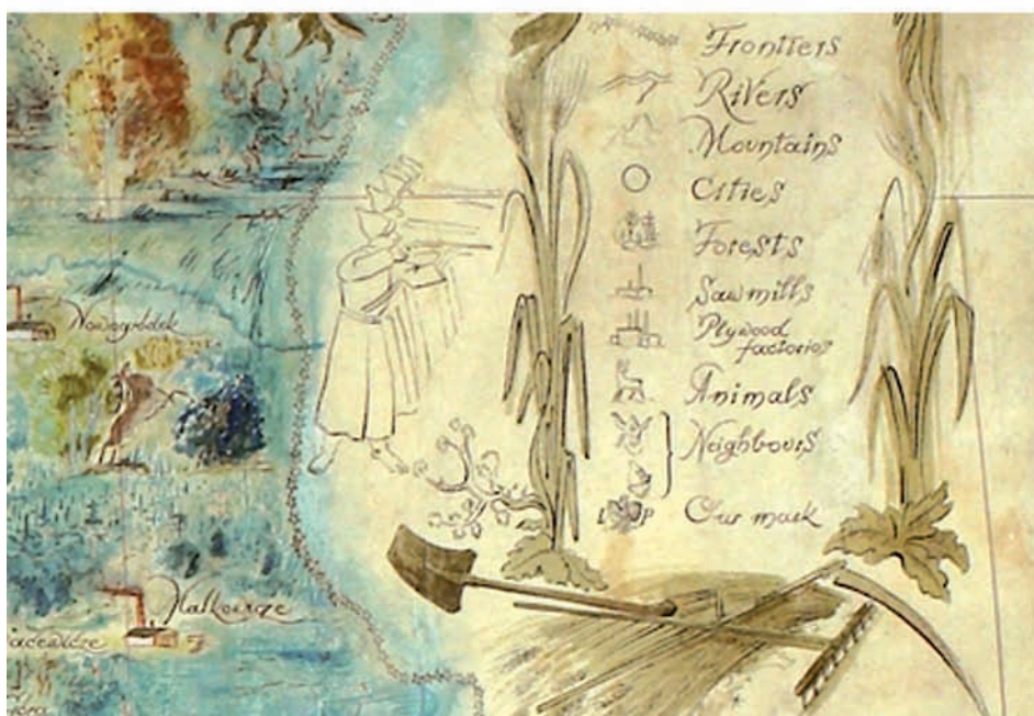
Ryc. 2. Germanowie i pododdział egzekucyjny NKWD przy granicach II Rzeczypospolitej na oryginalnej mapie Fig. 2. Germans and an SSP execution squad approaching the border of the Second Republic on an original map