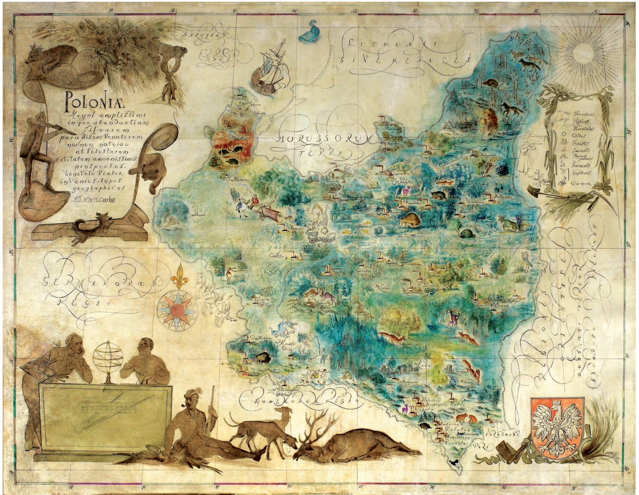
Ryc. 3. Oryginał „Mapy lasów polskich” po konserwacji w 1989 roku Fig. 3. The original of the “Map of Polish forests” after renovation in 1989