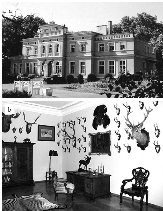
Fig. 3. Nature and Hunting Museum in Uzarzewo near Poznań: a – a general view, b – a hunter's cabinet

Władze powiatu pleszewskiego i ówczesnego województwa kaliskiego na początku lat 70. ubiegłego wieku wystąpiły do ministra leśnictwa i przemysłu drzewnego z inicjatywą, by na terenie byłej posiadłości hr. Jana Działyńskiego i małżonki księżnej Izabeli z Czartoryskich Działyńskiej utworzyć w Gołuchowie Muzeum Leśnictwa i Przemysłu Drzewnego 2 . Dobra te po II wojnie światowej zostały znacjonalizowane, a zamek w 1951 roku przekazano Muzeum Narodowemu w Poznaniu, które utworzyło tu swój oddział. Nadal systematycznie niszczone oficynę, a zabudowania gospodarcze wykorzystywała GS „Samopomoc Chłopska” na magazyny, punkty skupu żywca, płodów rolnych itd. Natomiast zabytkowy park dewastowały w straszliwy sposób całe stada krów i kóz (SOKOŁOWSKI 1946). Późniejsze koleje losu tego terenu były bardzo różne. Administracyjnie teren podlegał Nadleśnictwu Państwowemu Pleszew, a później WSR w Poznaniu. Czyniono także bezskuteczne zabiegi, by przekazać zabudowania na ośrodek wczasowy lub kolonijny, a władzom administracji lokalnej leżała na sercu „[...] troska o zabezpieczenie tego cennego zabytku przed postępującą dewastacją i groźbą całkowitego zniszczenia” (ryc. 4).