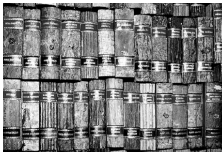
Ryc. 1. „Księgi drzewne” W. Kozłowskiego. Muzeum Diecezjalne w Sandomierzu

Fig. 1. “Wood books” by W. Kozłowski. Diocesan Museum in Sandomierz