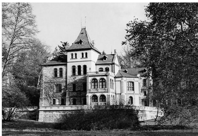
Ryc. 6. Muzeum Leśnictwa w Gołuchowie i jego wnętrze Fig. 6. The Museum of Forestry in Gołuchów and its interior