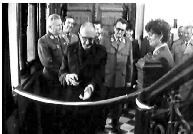
Ryc. 7. Przewodniczący Rady Naukowej i Dyrektor Naczelny Lasów Państwowych otwierają w 1986 roku Muzeum Leśnictwa w Gołuchowie