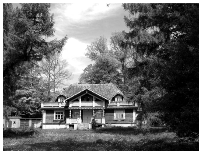
Fig. 2. A manor house of governor Grodzieński in Białowieża – at the end of the nineteenth century an exhibition of hunting trophies and souvenirs from czarist huntings

w którym jeden gatunek drzewa lub krzewu prezentowany był w postaci pędu bezlistnego i ulistnionego, nasion, drewna w różnych przekrojach, trocin, popiołu itd. Zbiory te także chętnie przekazywał różnym muzeom. Z pracy został wyrzucony za udział wraz ze swoimi leśnymi w powstaniu listopadowym, a także za rzekome napisanie znakomitego paszkwilu „[...] w szale rewolucyjnym ubliżającym nawet rodzinie panującej”. Przez kilka lat pracował w lasach Ordynacji Zamajskiej, a następnie przez 17 lat ponownie w lasach rządowych, ale już tylko jako pełniący obowiązki nadleśnego Leśnictwa Chlewiska w guberni radomskiej. W wyniku zemsty bliskiego sąsiada dwukrotnie płonęły wraz z całym domo-