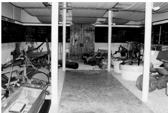
Ryc. 5. Ekspozycja techniki leśnej – OKL Gołuchów Fig. 5. An exhibition of forest technology – OKL Gołuchów

Gdy na przełomie lat 70. i 80. ubiegłego wieku zaobserwowano także w polskich lasach zjawisko ich masowego zamierania, Muzeum Techniki wspólnie z SITLiD zorganizowało w 1984 roku w Pałacu Kultury i Nauki w Warszawie czasową wystawę „Leśnicy ostrzegają”. VIP-om wysłano zaproszenia wydrukowane na bukowej okleinie, co dało satyrykom dowód, że w lasach polskich nie brak drewna.