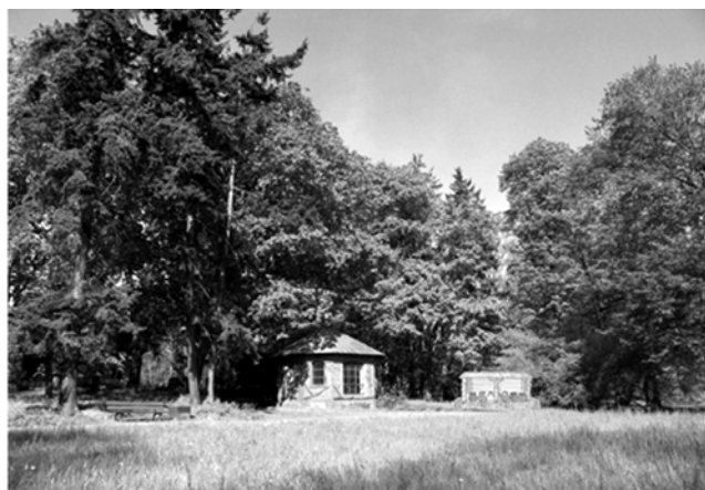
Ryc. 3. Otoczenie wokół budynku „Pasieka”: a – aktualny stan, b – wizualizacja terenu