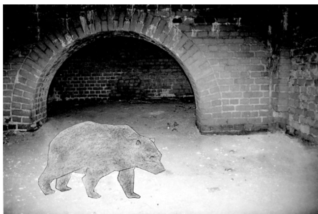
Fig. 1. Bear pavilion: a – the current state, b – visualization of the area

Ryc. 2. Wizualizacja wnętrza niedźwiedziarni