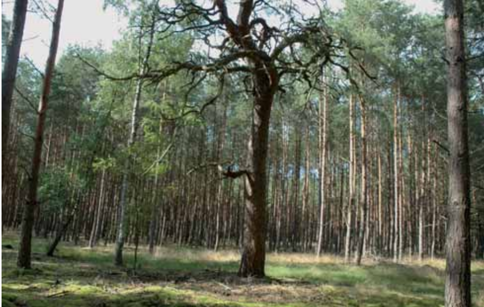
Ryc. 2. Sosna Napoleona – historyczna sosna zwyczajna o ciekawym pokroju (Nadleśnictwo Potrzebowice, Leśnictwo Rosko, oddz. 153Dc)

Fig. 2. Sosna Napoleona – historical pine (Potrzebowice Forest District)