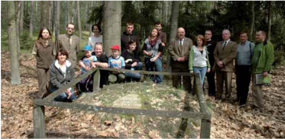
Ryc. 6. Święto Lasu – kamień upamiętniający Pierwsze Święto Lasu w 29.04.1933 (Nadl. Międzychód, L. Mokrzec, oddz. 156b). Na zdjęciu grupa naukowców z Zachodniopomorskiego Uniwersytetu Technologicznego wizytująca Nadl. Międzychód w dniu 26.04.2012 roku Fig. 6. Forest Day – memorial stone dedicated to the first Forest Day in 29 April 1933 (Międzychód Forest District). On the photo scientists from Zachodniopomorski Uniwersytet Technologiczny, guests of Międzychód Forest District