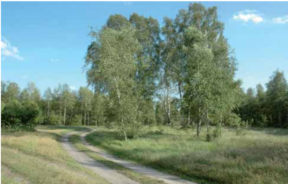
Ryc. 3. Żelasko – miejsce nieistniejącej osady na styku trzech nadleśnictw: Krucz, Potrzebowice i Wronki

Fig. 2. Sosna Napoleona – historical pine (Potrzebowice Forest District)