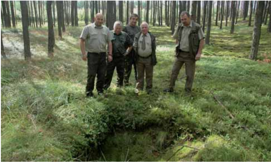
Ryc. 4. Studnia – miejsce przy starej studni, zbudowanej w latach 20. XX w. na szkółce gospodarczej produkującej sadzonki w celu odnowienia Puszczy Noteckiej po jej zniszczeniu przez strzygonię choinówkę (Nadleśnictwo Krucz, Leśnictwo Tarnowiec, oddz. 118b). Na zdjęciu pracownicy Nadleśnictwa Krucz, w dniu 19 lipca 2012 roku

Fig. 4. Studnia – place near old well built in the 20s of XXth century in forest nursery producing seedlings in order to restore Notecka Primeval Forest after its destruction by Panolis flammea (Krucz Forest District). On the photo workers of Krucz Forest District on 19 July 2012