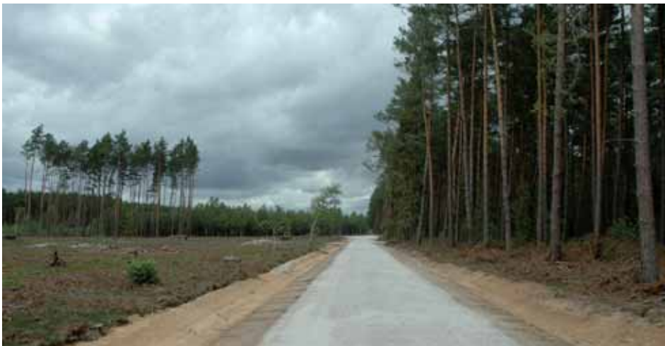
Ryc. 5. Transpuszczańska – droga o długości 118 km, łącząca wschodni i zachodni kraniec Puszczy Noteckiej. Na zdjęciu odcinek wybudowany w lipcu 2012 roku na terenie Nadleśnictwa Oborniki

Fig. 4. Studnia – place near old well built in the 20s of XXth century in forest nursery producing seedlings in order to restore Notecka Primeval Forest after its destruction by Panolis flammea (Krucz Forest District). On the photo workers of Krucz Forest District on 19 July 2012