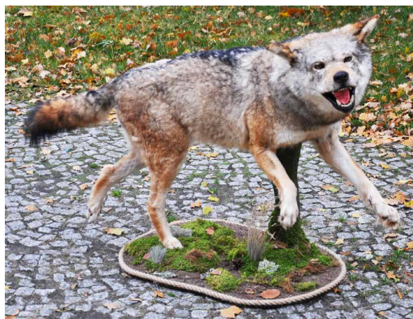
Ryc. 5. Dermoplast wilka, nabytek do zbiorów muzealnych

Fig. 4. Desk after renovation, for display in the Room of Tradition of the Directorate General of the State Forests in Warsaw