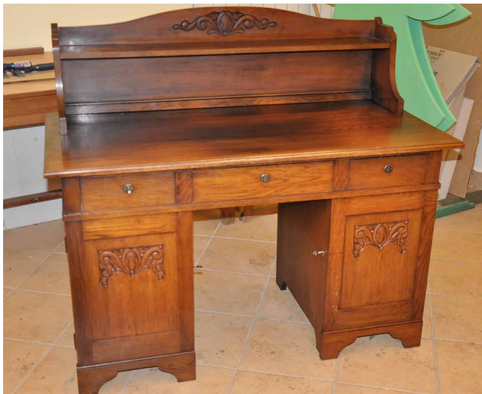
Ryc. 4. Biurko po konserwacji, przeznaczone do eksponowania w Izbie Tradycji w Dyrekcji Generalnej Lasów Państwowych w Warszawie

Fig. 4. Desk after renovation, for display in the Room of Tradition of the Directorate General of the State Forests in Warsaw