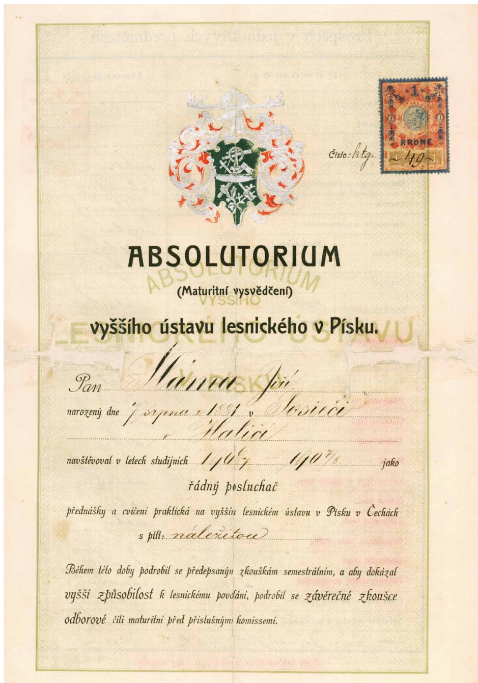
Ryc. 1. Dokumentacja archiwalna związana z postacią leśnika Jana Slamy