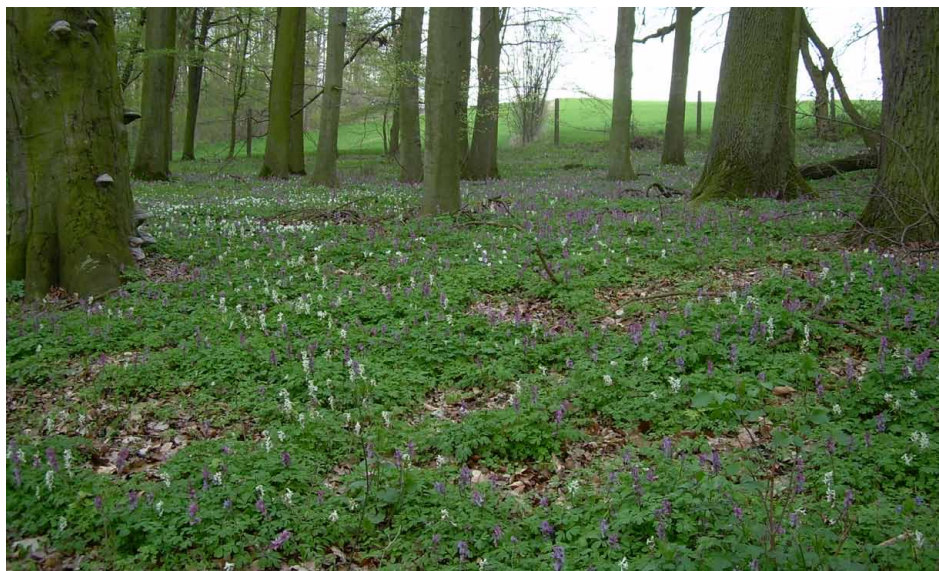
Ryc. 3. Stanowisko kokoryczy pustej w oddziale 31. parku-arboretum

Fig. 3. The surface with Corydalis cava in section No 31 of park-arboretum