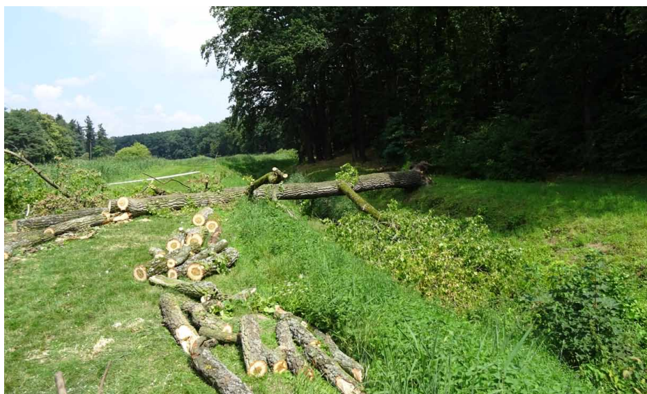
Ryc. 4. Wywrot topoli na grobli w parku-arboretum

Fig. 3. The surface with Corydalis cava in section No 31 of park-arboretum