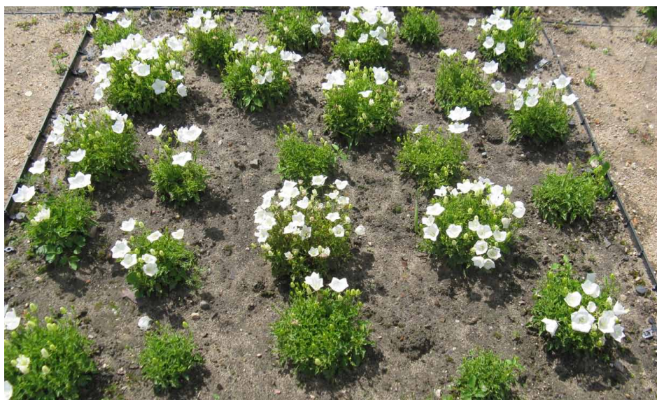
Ryc. 2. Dzwonek karpacki w ogrodzie ziołowo-kwiatowym Fig. 2. Campanula carpatica in the flower-herbal garden