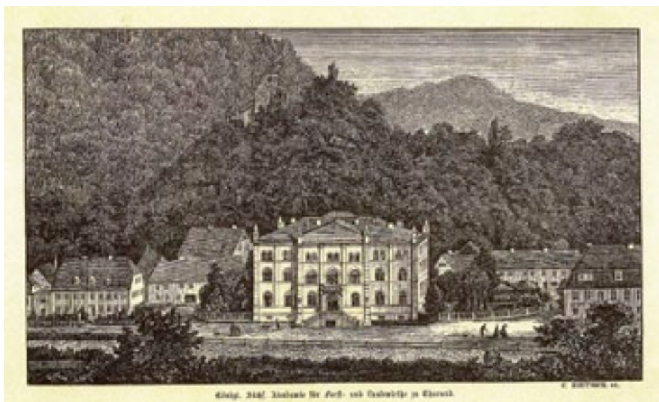
Ryc. 2. Najstarszy budynek Akademii Leśnej pobudowany w latach 1847–1849