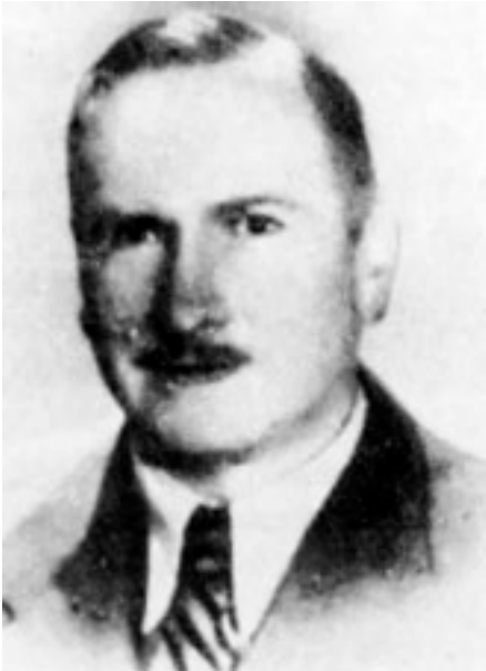
Ryc. 22. Teofil Lorkiewicz Fig. 22. Teofil Lorkiewicz