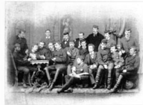
Corpsstudenten der schlagenden Verbindung „Hubertia” im Wintersemester 1879/1880